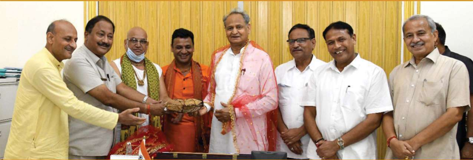
ब्रज की रक्षा के प्रति समिति एवं राजस्थान सरकार के आपसी सहयोग की मिसाल एवं आंदोलन की सफलता।