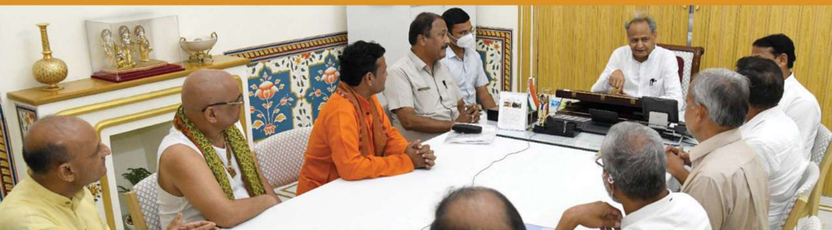
ब्रज पर्वत एवं पर्यावरण संरक्षण समिति की राजस्थान के मुख्यमंत्री श्री अशोक गहलोत जी एवं अन्य अधिकारी गण के साथ बैठक।