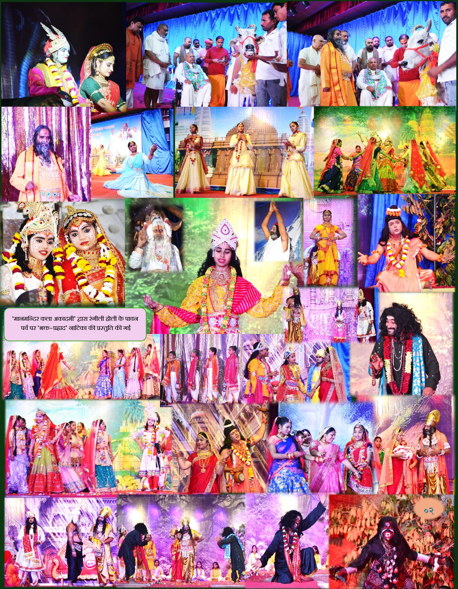
'मानमन्दिर कला अकादमी' द्वारा रंगीली होली के पावन पर्व पर 'भक्त-प्रह्लाद' नाटिका की प्रस्तुति की गई