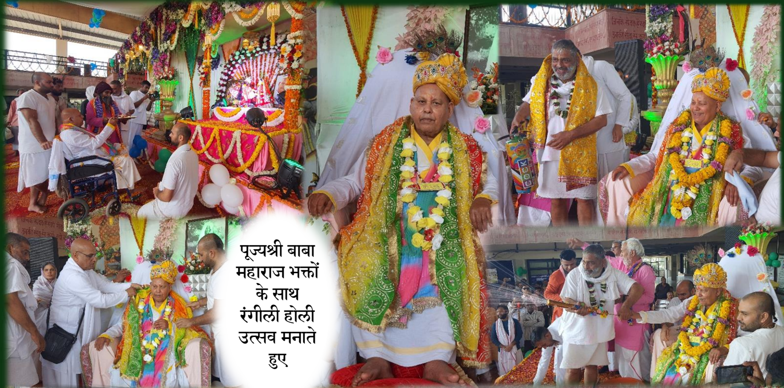
पूज्यश्री बाबा महाराज भक्तों के साथ रंगीली होली उत्सव मनाते हुए