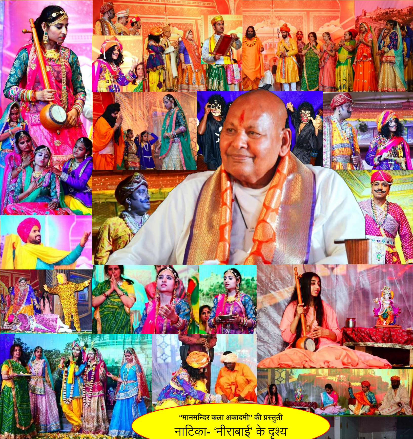
“मानमन्दिर कला अकादमी” की प्रस्तुती नाटिका- 'मीराबाई' के दृश्य