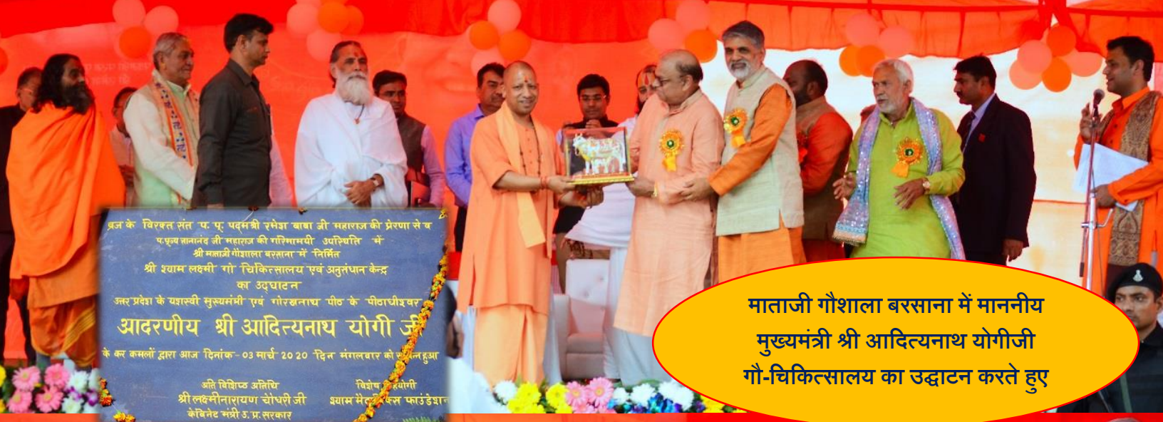
माताजी गौशाला बरसाना में माननीय मुख्यमंत्री श्री आदित्यनाथ योगीजी गौ-चिकित्सालय का उद्घाटन करते हुए